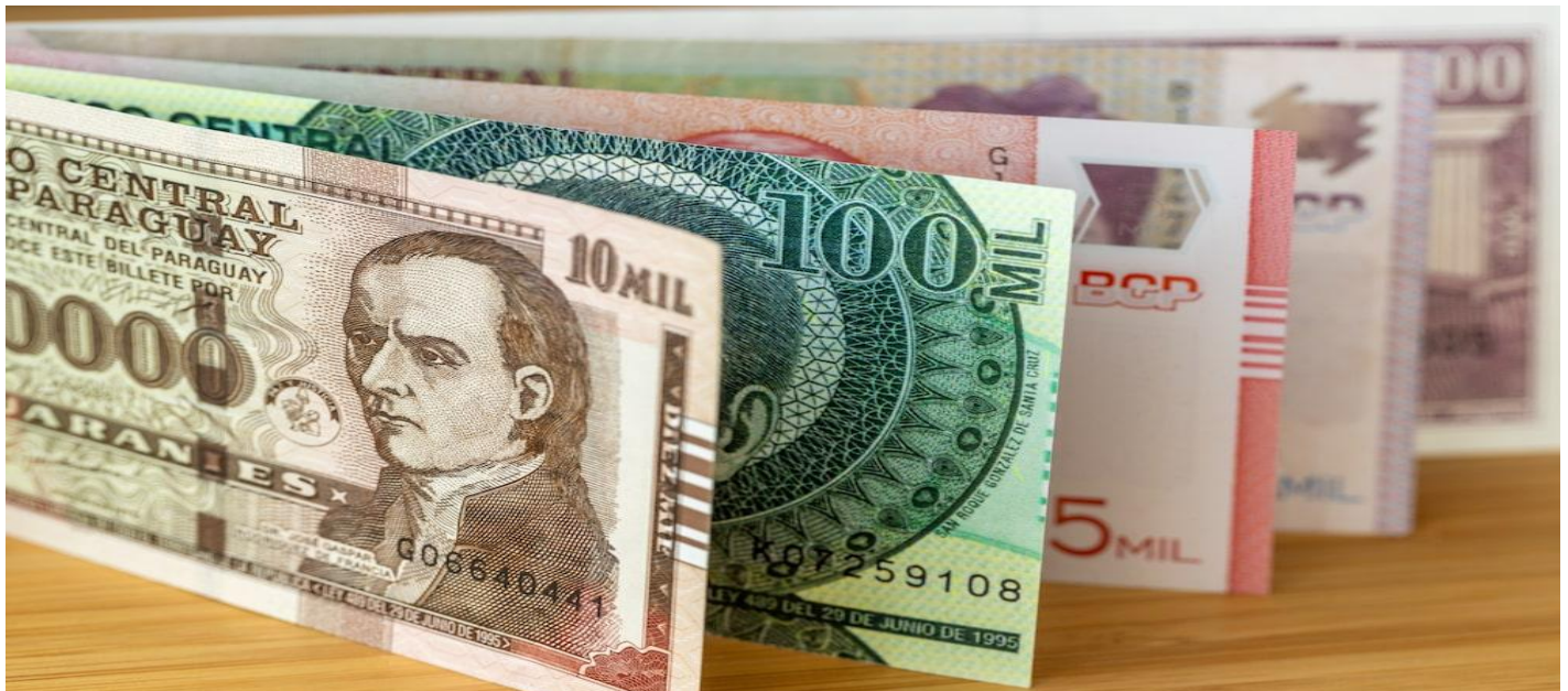
Guaraní paraguayoDinero de Paraguay. Concepto económico financiero. Símbolo de moneda guaraní paraguayo

Hacia adelante, el analista Amílcar Ferreira dice que las perspectivas apuntan a un dólar estable o, incluso, con tendencia a la baja durante el primer semestre de 2026 en Paraguay .